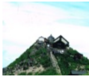
そして月山神社本宮は

羽黒山山頂の三神合祭殿の前にある鏡池は古来から神秘的な池として信仰の中心であり、奉納された銅鏡が埋納されていたとの事です。各地で納鏡の信仰はありますが鏡の枚数では羽黒鏡が他を圧倒しており銅鏡（重要文化財）の一部が出羽三山歴史博物館に展示されています。一部とはいえ多くの銅鏡を拝観していると、羽黒信仰の強さや深さを感じられずにはいられません。