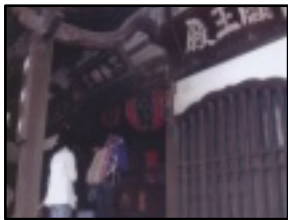
次に4番目の目青不動

でも約500mの道のりで、途中商店街の中を歩きました。自家用車だと境内の前まで行くことができ、コインパーキングの駐車場もありました。(毎月28日は大縁日で、この時は駐車できないかも知れないです。)階段を上すると大きな立派な大本堂がありました。堂内には上がらせていただき、皆で御真言と般若心経のお経を唱えました。そして、ご住職の説法をいただきました。中は写真撮影の露座の銅製仏像を拝見しました。あまりにご立派なのにびっくりしました。この仏像は膝前で印を結ぶ胎蔵界大日如来像で、天和3年(1683年)の作だそうです。行かれたときは是非ご覧になってください。