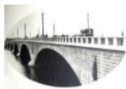
建設当時の萬代橋